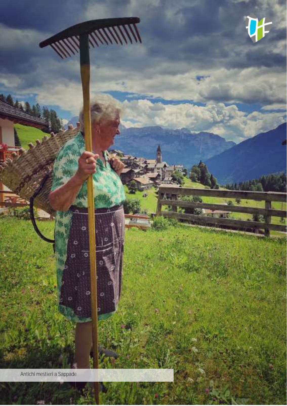
Antichi mestieri a Sappade