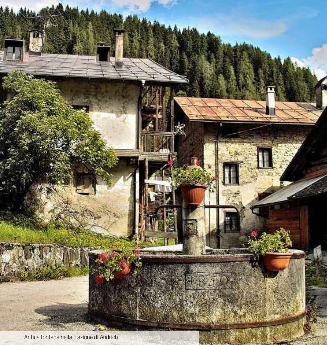
Antica fontana nella frazione di Andrich