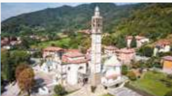
Sotto il Monte Giovanni XXIII