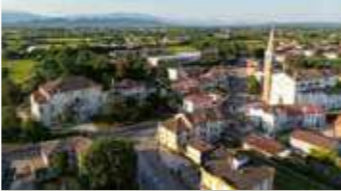
Riese Pio X